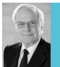
David de Rothschild, Président

Ensemble, bâtissons l'avenir de la psychiatrie.